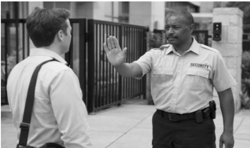
(Unarmed Security Guard stops a visitor at the entry gate)

7. Visitor Management (आगंतुक प्रबंधन) -Visitor management का मतलब है किसी भी जगह पर आने-जाने वाले लोगों और गाड़ियों की सही तरीके से जांच और रिकॉर्ड रखना। जब कोई बाहर का व्यक्ति किसी बिल्डिंग, फैक्ट्री या ऑफिस में आता है, तो सबसे पहले उसकी मुलाकात Security Guard से होती है। एंट्री गेट पर अक्सर 'STOP' का साइन लगा होता है, जिसका मतलब है कि अंदर जाने से पहले सुरक्षा जांच जरूरी है।